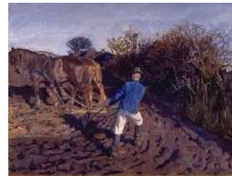
Peter Hansen. Pløjemanden vender , 1900-02. Faaborg Museum.

limalb@ordrupgaard.dk . Billedmateriale kan fås ved at henvende sig til presseansvarlige