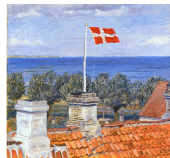
Johannes Larsen. Sommer, solskin og blæst . 1899. Ordrupgaard.