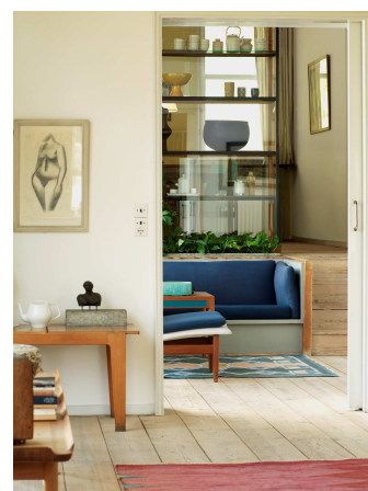
Finn Juhls hjem i Charlottenlund.

Den samme farveholdning er at finde i Juhls eget hjem fra 1942.