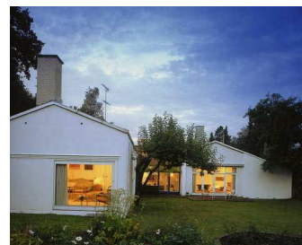
Finn Juhls hus ved Ordrupgaard. Sommernat.