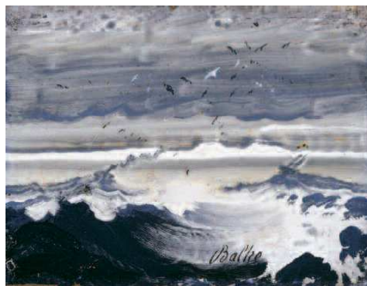
Peder Balke: Fugleflok over oprørt hav , ca. 1870

Vi skal undersøge de maletekniske 'tricks', som den danske samtidskunstner og den norske landskabsmaler har til fælles, og som de som bruger til at skabe deres landskabsmalerier. Kirkeby og Balke lader sig begge inspirere af håndværksmalerens 'tricks'. Håndværksmaleren skaber med redskaber som gummigreb og spartler enkelt og hurtigt en illusion af træ eller marmor. Ved at bruge disse 'tricks' skaber de to kunstnere overraskelser for øjet, som er helt anderledes end den måde traditionelle kunstnere 'narrer' øjet på gennem f.eks. perspektivet.